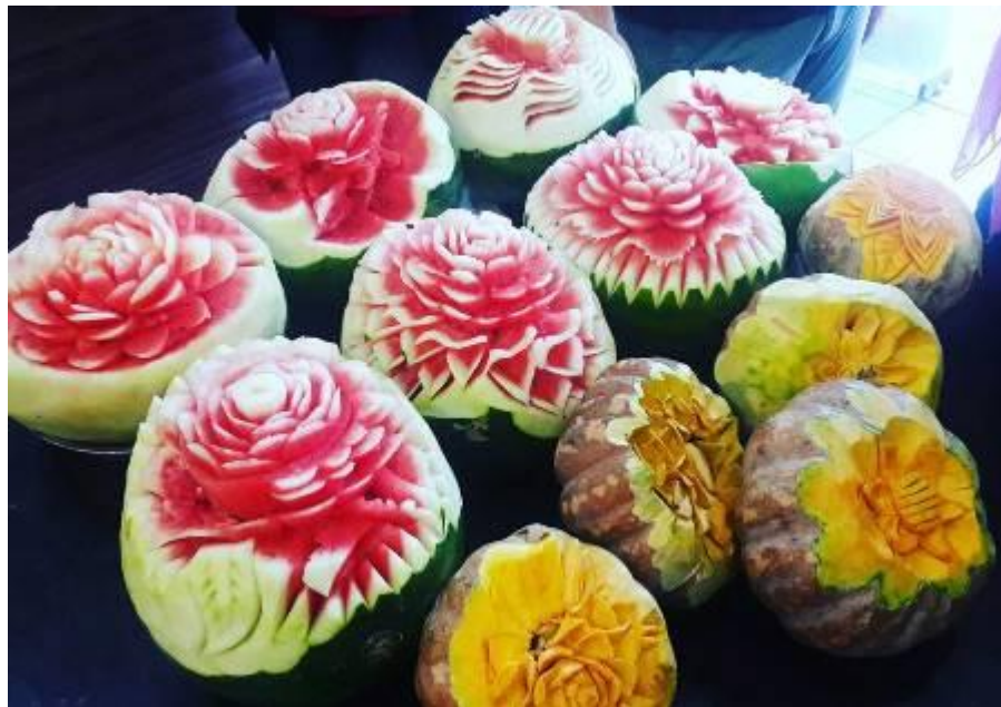
Caption : Cik Azwani mengikuti kursus kulinari